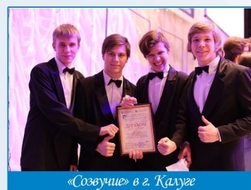
«Созвучие» в г. Калуге