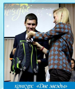
конкурс «Две звезды»

конкурсных этапов: творческая визитка, интеллектуально-юмористический конкурс, видео-конкурс, исполнительский конкурс по специальности. Конкурс раскрыл многогранность творческих проявлений преподавателей и их учеников. Наши участники стали дипломантами конкурса и получили спец приз радио «Европа плюс».